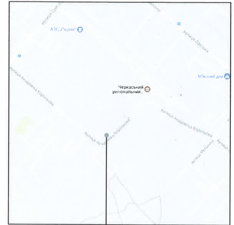
Місце розташування земельної ділянки